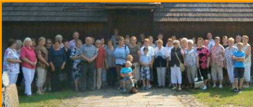
Pouť do Ostravy Hrabové - kostel svaté Kateřiny