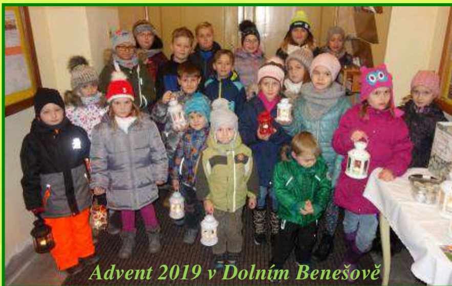
Advent 2019 v Dolním Benešově