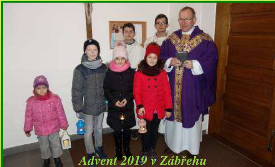
Advent 2019 v Zábřehu