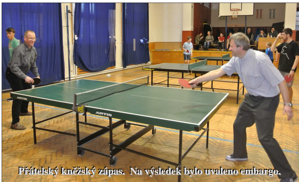
Prátelský kněžský zápas. Na výsledek bylo uvaleno embargo.