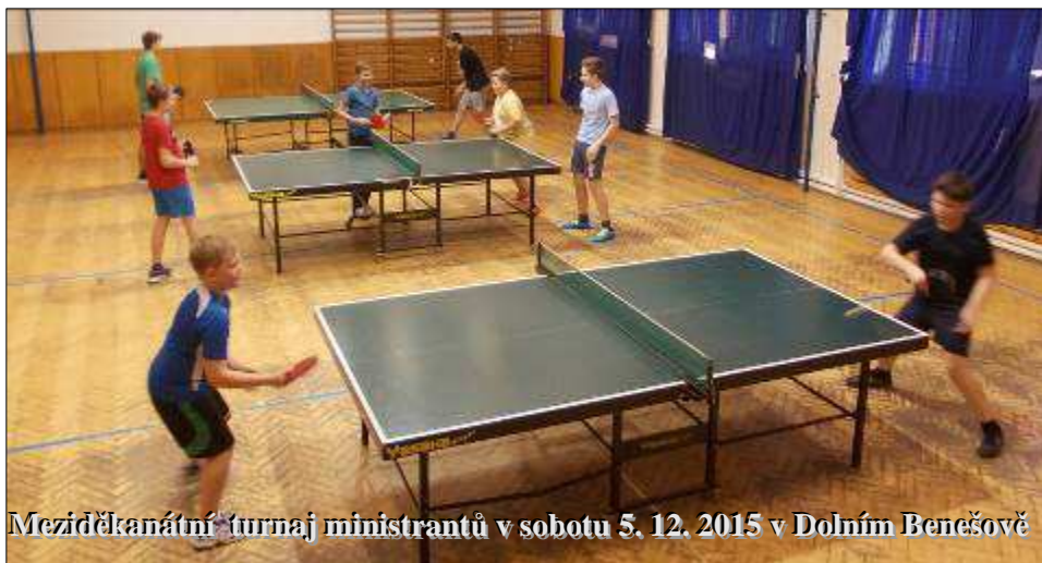
Meziděkanátní turnaj ministrantů v sobotu 5. 12. 2015 v Dolním Benešově