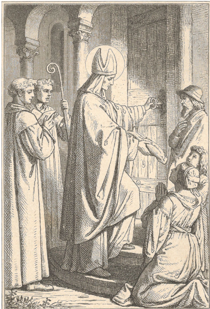
Der heilige Benno.

Jindřich IV. 1084 vyhnal papeže Řehoře z Říma a nechal se korunovat císařem. Roku 1085 nechal Benna mohučským synodem exkomunikovat a sesadit z místa míšeňského biskupa a dosadil protibiskupa.