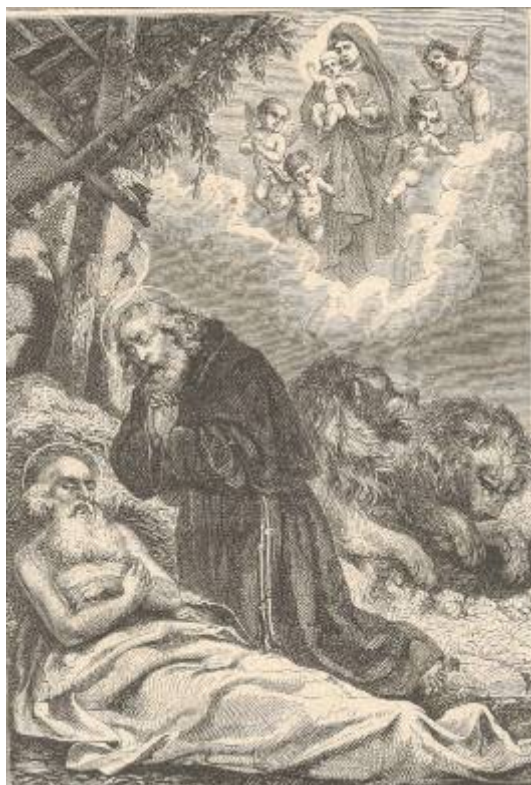
Perokresba je z knihy Leben der Heiligen Gottes, vydaná v roce 1880

Za Decia, v začátku pronásledování křesťanů, se Pavlovi nevěřícímu švagrovi naskytla příležitost, aby se zmocnil jeho majetku. Zřejmě byl Pavel upozorněn svojí sestrou na zrádné kroky jejího muže a jelikož dal přednost své víře, vzdálil se do pouště, aby tam sloužil Pánu, po kterém toužilo jeho srdce. Těm, kdo prožívají opravdovou lásku, stačí být spolu. Člověk je ale bytostí nedokonalou a navíc, vystaven útokům nepřítele, záhy má obtíže, které mu život "jaksepatří" znesnadní. Ale všechny dary od Boha a všechna vítězství dají pocítit, že život přesto stojí zato. Po strastiplném hledání našel Pavel místo, které přijal jako dar od Boha. Byl to skalní útvar s palmou i s pramenitou vodou u jeskyně. Podle nalezených věcí v minulosti zřejmě sloužila i penězokazům. Pavel ji modlitbou přetvářel ve chrám. Vždy je důvod Boha chválit, zač děkovat a o co prosit. Je-li modlitba stále častější, tím větší v ní člověk nachází zalíbení. A není na škodu si připomenout, že modlitba je projev lásky a důvěry. Proto vytrvalá modlitba přetváří srdce.