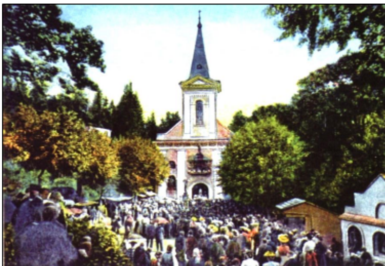
(Pout' z 50. let minulého století)

Po zákazu poutní obraz Panny Marie Pomocné putoval po okolních farnostech.