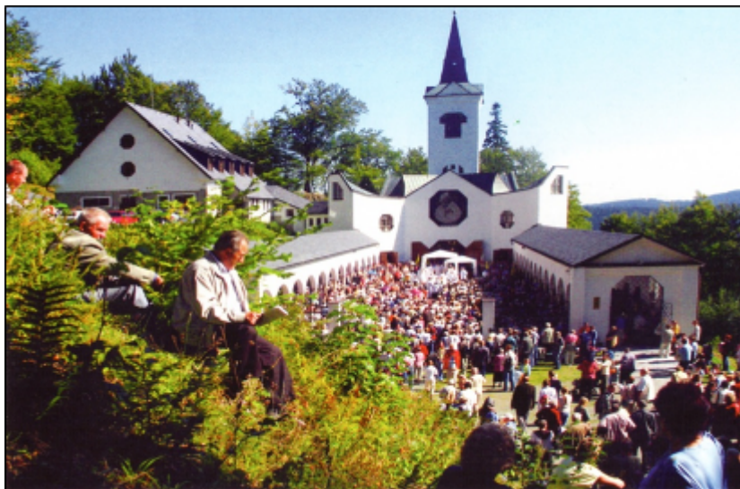
(Pouť „Tří národů“ v roce 2006)