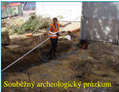
Souběžný archeologický průzkum