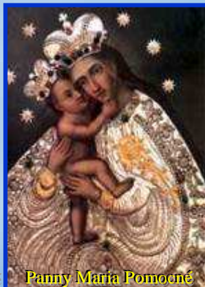
Panny Maria Pomocné