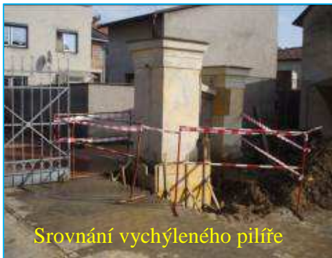
Srovnání vychýleného pilíře