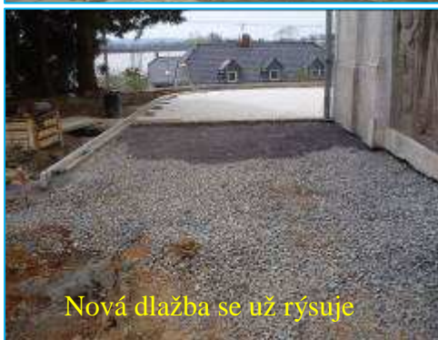
Nová dlažba se už rýsuje