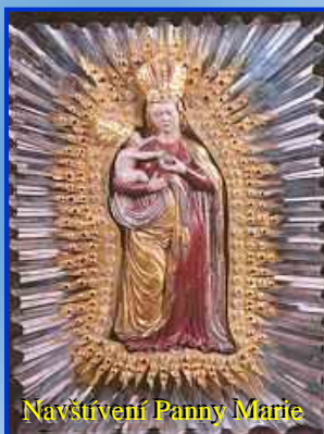
Navštívení Panny Marie