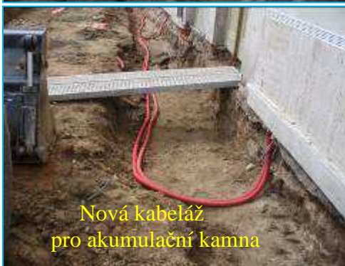
Nová kabeláž pro akumulční kamna