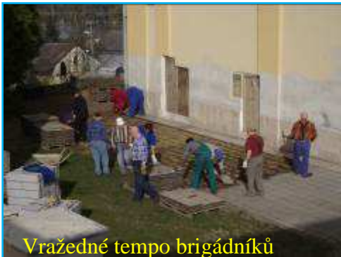
Vražedné tempo brigádníků