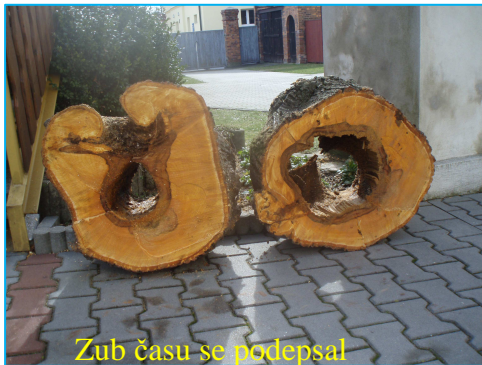
Zub času se podepsal