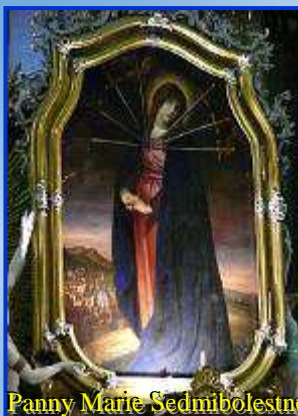
Panny Marie Sedmíbolestné