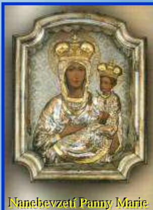
Nanebevzeří Panny Marie