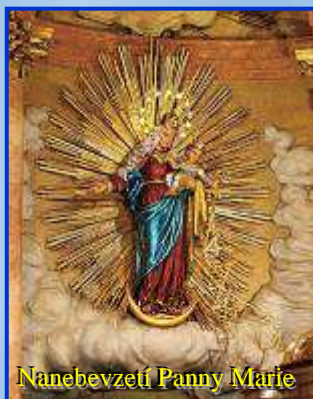
Nanebevzeří Panny Marie