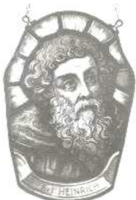
Jindřich z Ebrantshausenu. Podle malby na skle Z 19 století ve farním úřadě v riedenburgu

Zemřel kolem roku 1185 v Ebrantshausenu, Bavorsko.