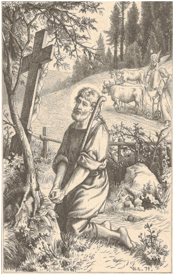
Der heilige Isidor.

do níž se zamiloval. Isidor přijal nové povolání a svátostí manželství začal s Marií nový společný život. Je psáno, že vytvořili dobré a svaté manželství. O tom hovoří i pozdější skutečnost, že i Marie byla nakonec blahoslavená s památkou 9. 9. Byla velmi aktivní v prokazování dobra a ve štědrosti k chudým. Spolu měli jen jednoho syna, který jim však v dětském věku zemřel.