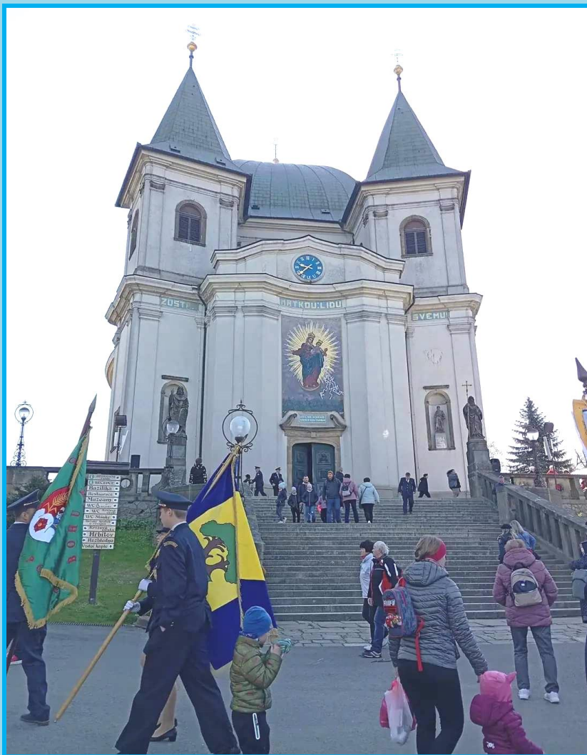
Svatý Hostýn – významné mariánské poutní místo v olomoucké arcidiecézi

Ať „NEDĚLNÍČEK“ vnese do Vašich rodin příjemné, pokojné, a sváteční chvíle "