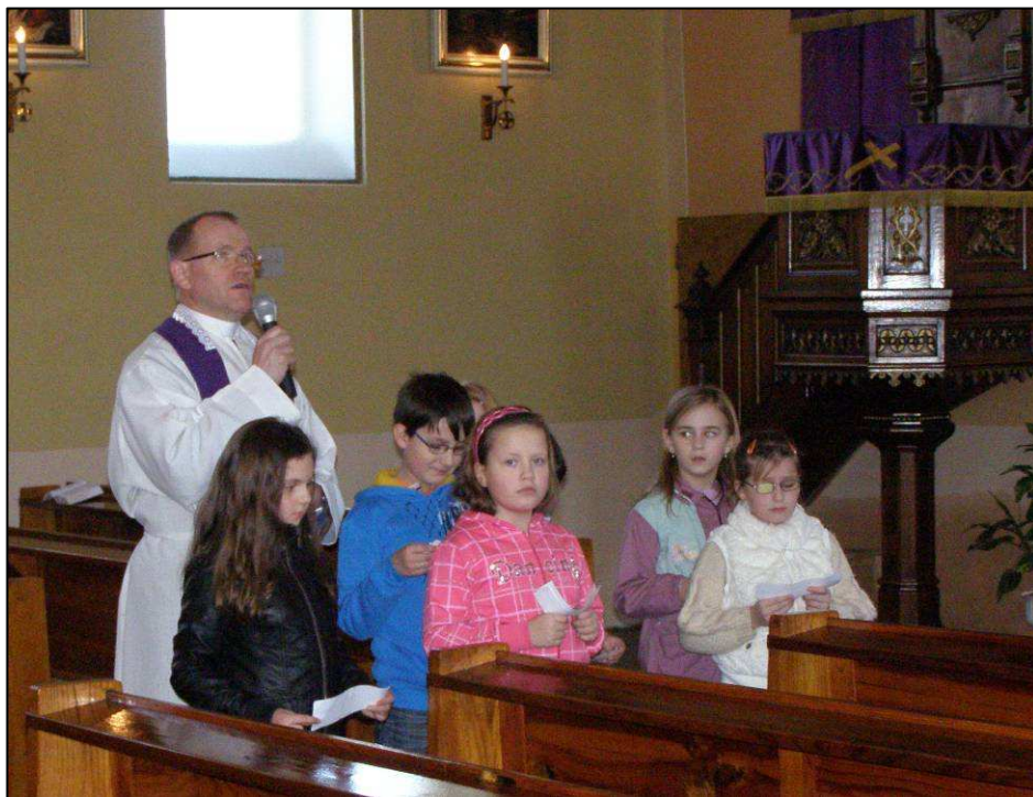
Křížová cesta dětí v Zábřehu