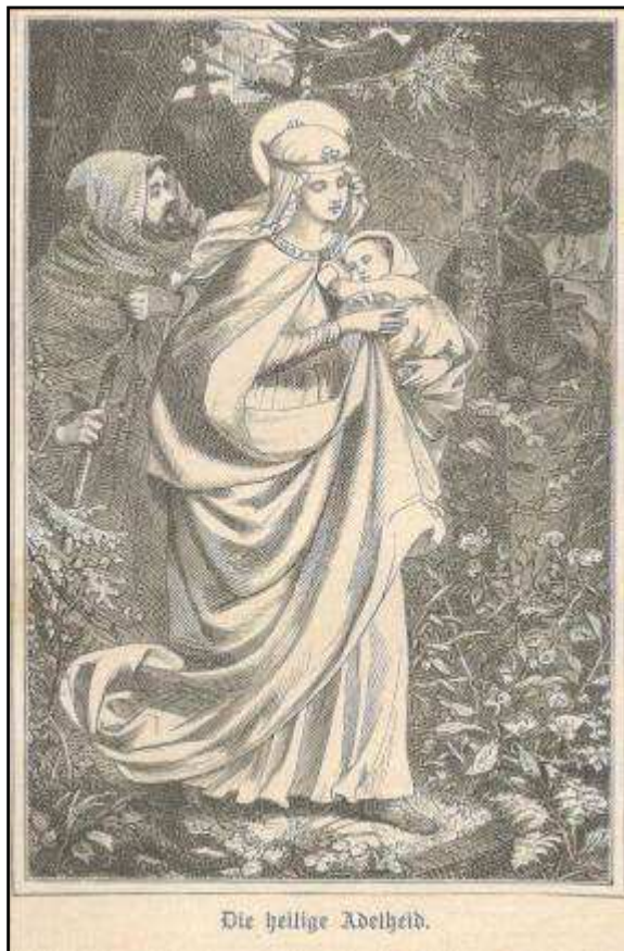
Perokresba je z knihy Leben der Heiligen Gottes r. 1880

dočasně ujala Teofana a vyvolala jistý odpor. V té době za Adélou přišla také její dcera Emma, kterou po smrti jejího muže vyhnal její syn Ludvík.