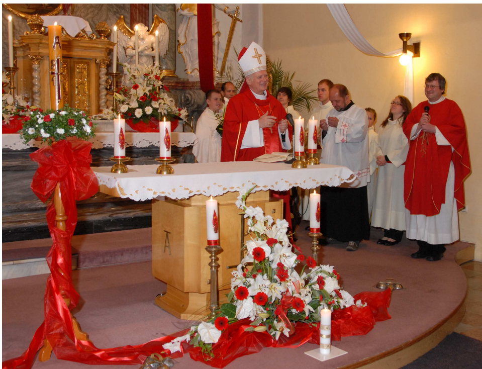
Bířmování 28.5.2011 v Dolním Benešově