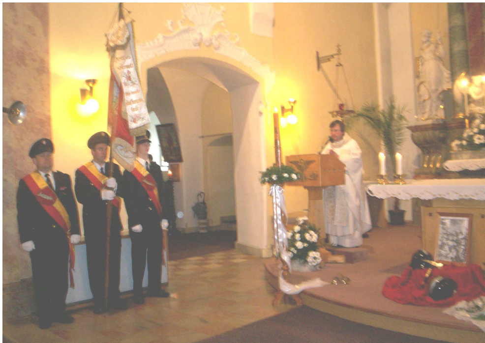
Hasičská mše svatá