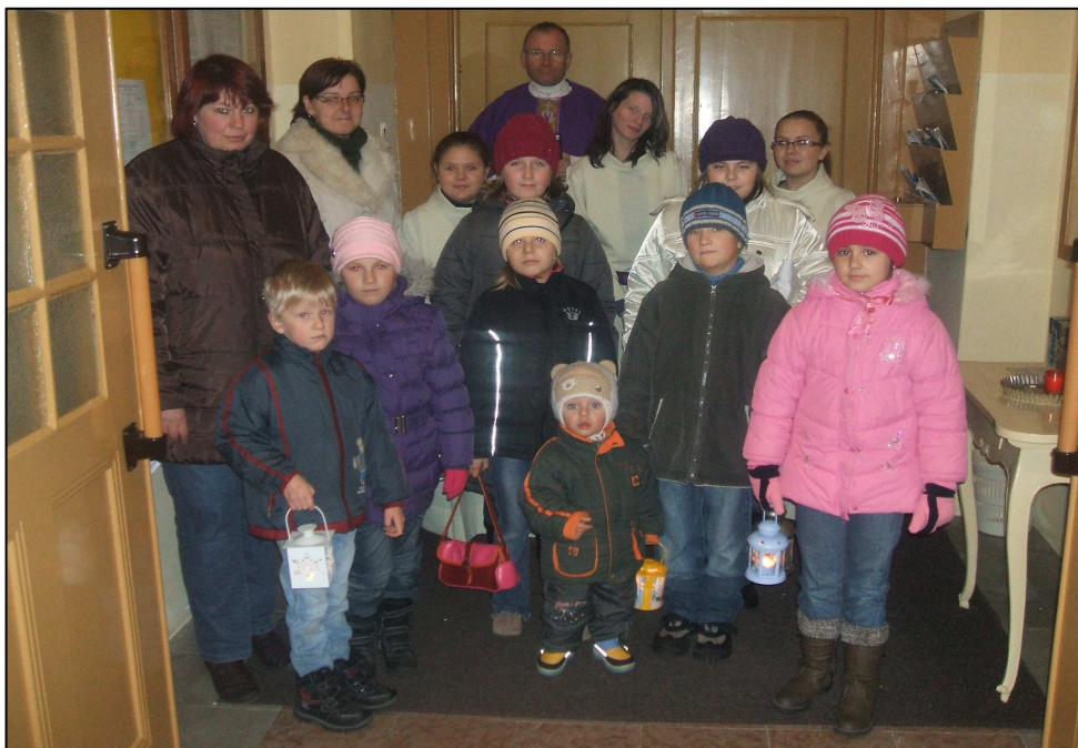
Děti s lampičkami přišly na roráty