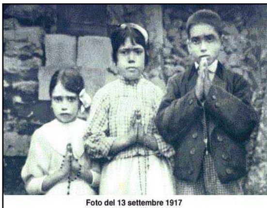
Foto del 13 settembre 1917

- „Žádali mě, abych vás poprosila o mnoho věcí, o uzdravení některých nemocných a jednoho hluchoněmého.“