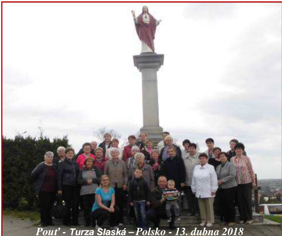
Pout' - Turza Slaská – Polsko - 13. dubna 2018